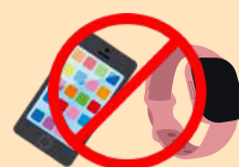
電子產品、貴重物品 (手機、平板、智慧型手錶...)

1.參加營隊前，請家長確認孩子是否有發燒情況，若達38℃或有嘔吐、拉肚子情況，請在家休養。