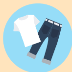
換洗衣物2~3套 (內衣褲、襪子)