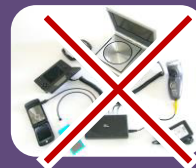
電子產品、貴重物品 (手機、mp3、平板...)